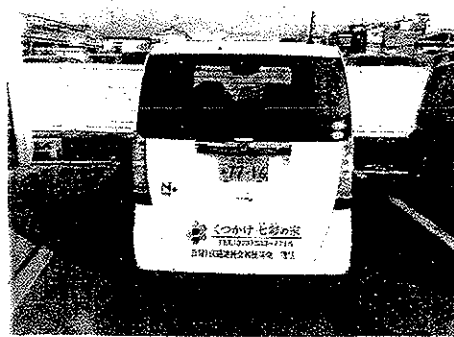
社会福祉法人 洛西福祉会