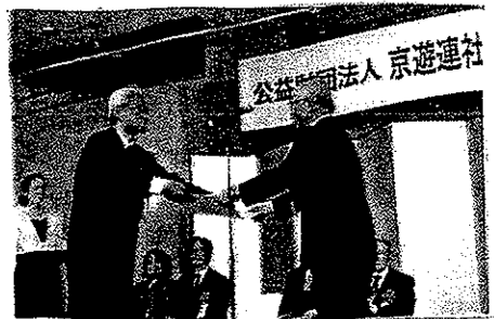
財団創立 30 周年記念式典(特別助成)